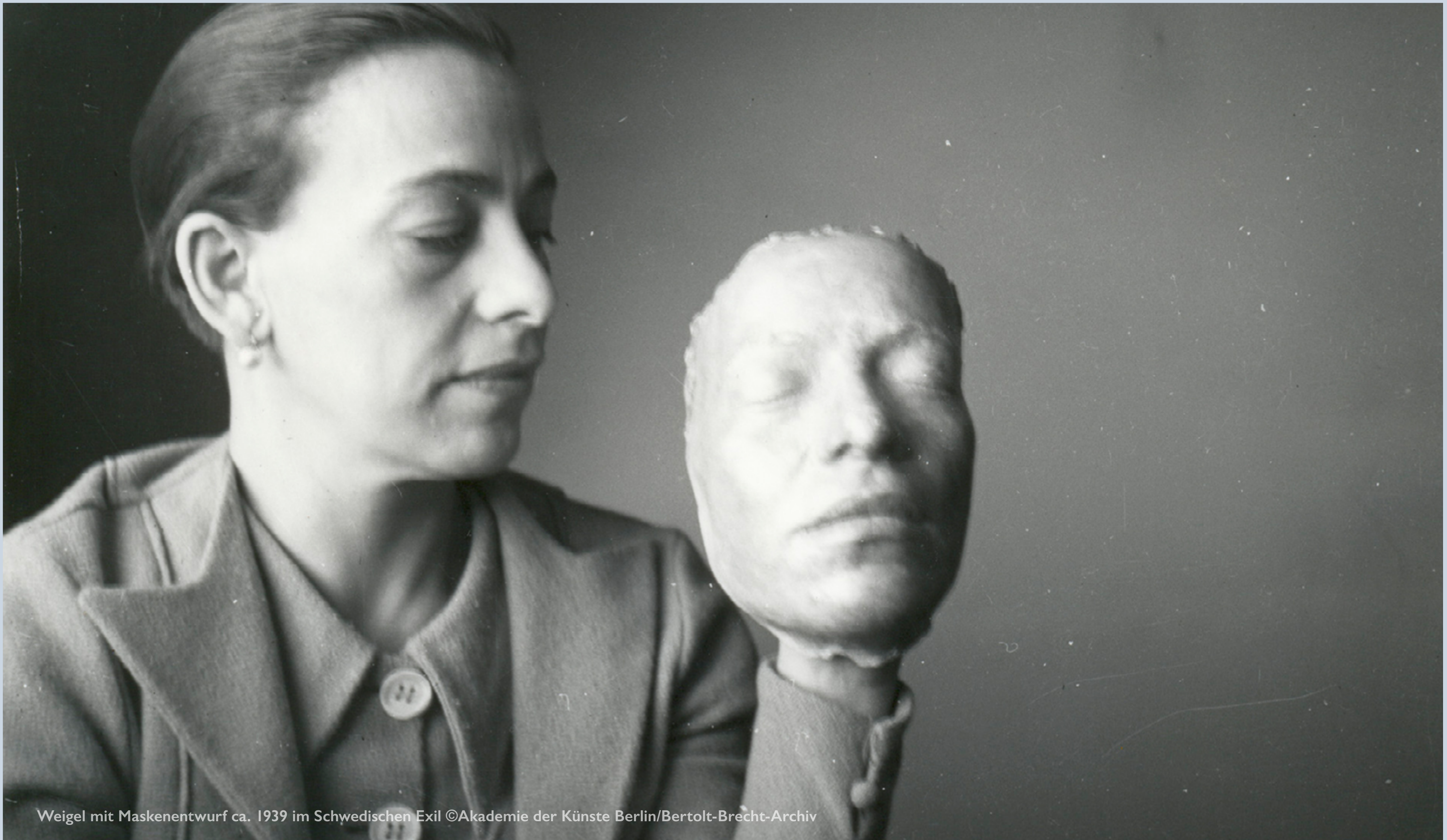
Weigel mit Maskenentwurf ca. 1939 im Schwedischen Exil