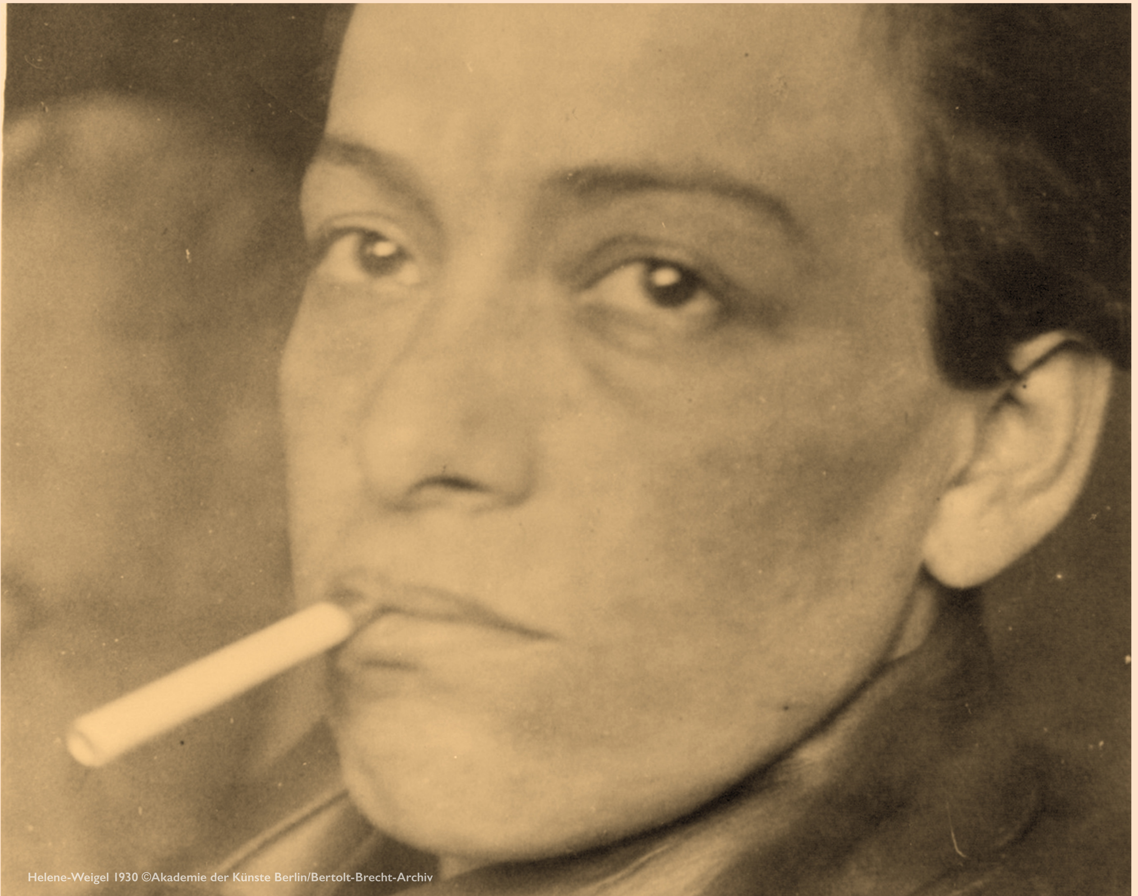
Helene-Weigel 1930