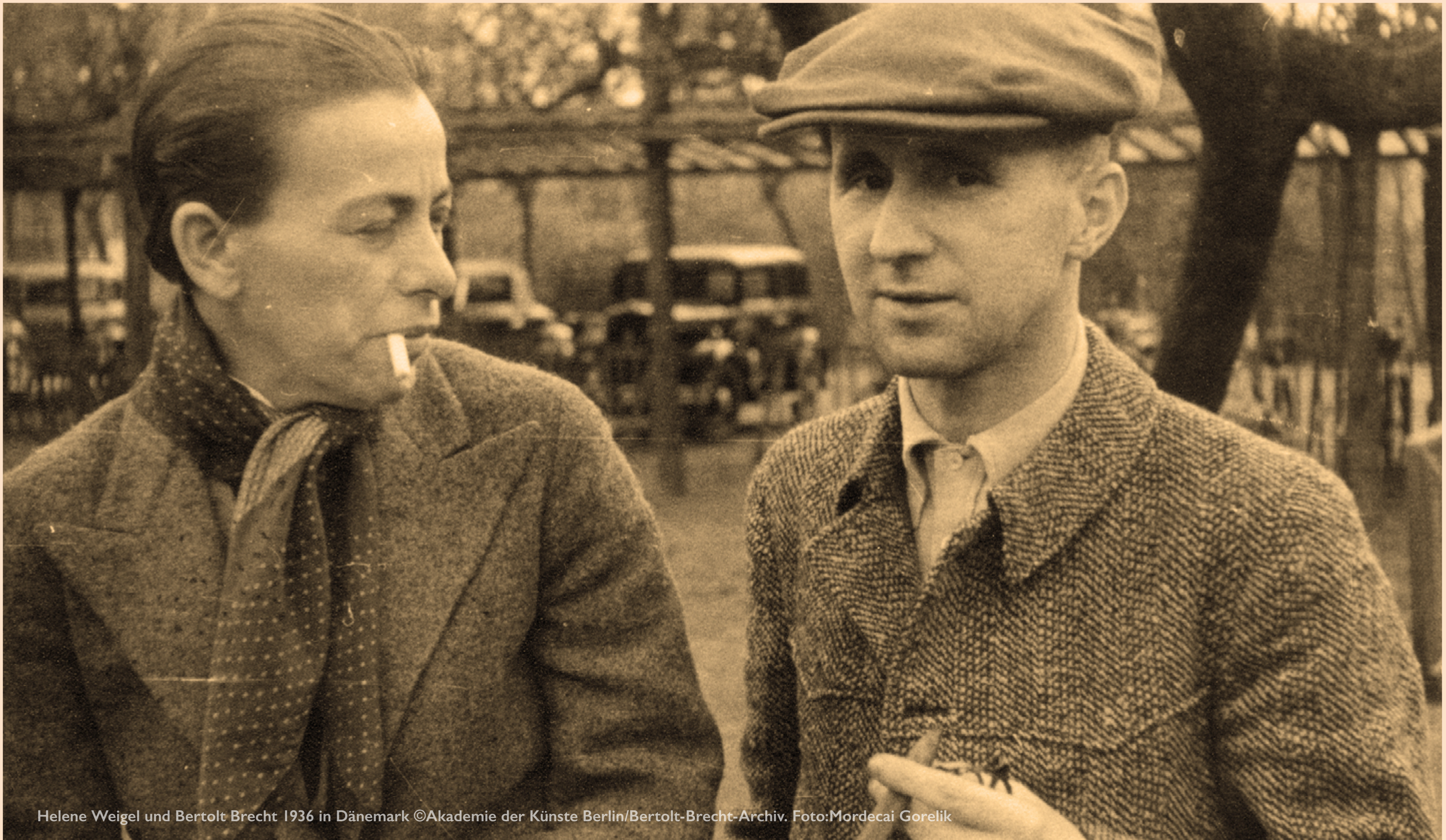
Helene Weigel und Bertolt Brecht 1936 in Dänemark